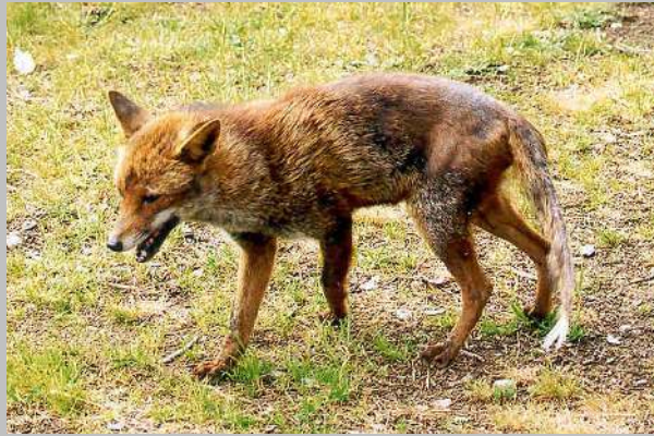
Abb. 2. Rüdiger Fuchs, lebend: Der Haarausfall und die schwarze Verfärbung der Haut sind im Bereich des hinteren Rückens und der Oberschenkel gut sichtbar.