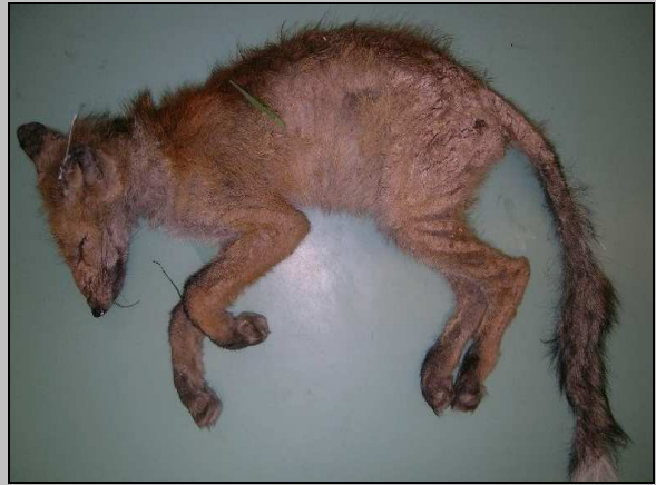
Abb. 3. Rüdiger Fuchs, tot aufgefunden: Der ganze Körper ist mit dicken Krusten bedeckt und der Haarausfall ist fast überall stark ausgeprägt.

als ob die Mehrheit der Individuen eine gewisse Immunität oder Resistenz gegenüber der Krankheit entwickelt hätte - über längere Zeitperioden beobachtet man ein zyklisches Auftreten der Krankheit. Andere Faktoren spielen ebenfalls eine Rolle in der Ausbreitung einer Epidemie: Die Bewegungen der einzelnen Individuen innerhalb einer Population (z.B. in Zusammenhang mit dem Nahrungsangebot), die Populationsdichte und das Sozialsystem bestimmen die Häufigkeit der Kontakte zwischen den Tieren und beeinflussen dadurch die Übertragung des Krankheitserregers. Eigentliche Epidemien sind tatsächlich nur bei sozialen Tierarten bekannt, wie bei Füchsen, Wölfen, Gämsen oder Steinböcken. Bei vorwiegend einzeltägerischen lebenden Arten wie Bär, Luchs, und Marder werden eher Einzelfälle festgestellt.